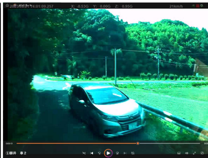
狭い道路の予測運転を