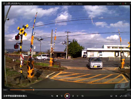
穴道中前踏切の走行